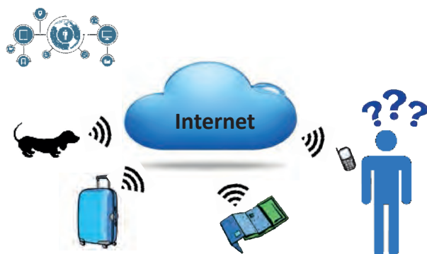
FIGURA 1. En un futur proper, milions d'objectes quotidians incorporaran un sistema electrònic encastat amb capacitat d'interconnexió mitjançant Internet.