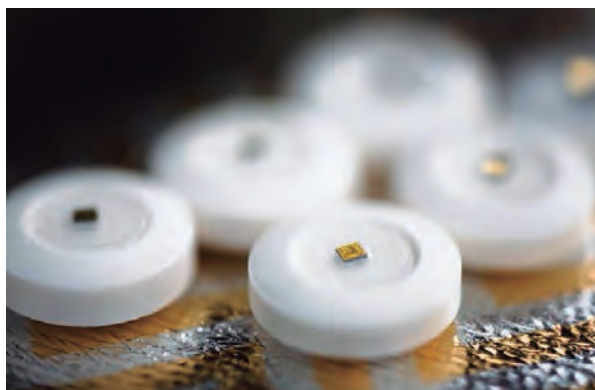
FIGURA 4. Els xips submil·limètrics ingeribles incorporats a les pastilles podrien proporcionar dades de camp molt valuoses a les indústries farmacèutiques.

La revolució dels xips amb elements microelectromecànics integrats (MEMS) ha representat un nou paradigma en el disseny de sistemes encastats. Amb aquestes tecnologies, alguns dels elements mecànics o electromecànics es poden integrar a escala micromètrica dins dels xips. Gràcies a aquestes tecnologies hi ha disponibles en el mercat dispositius anomenats smart sensors (senyors intel·ligents). Aquests xips smart sensors estan dotats de capacitats sensorials per a adquirir dades de l'ambient i transmetre-les per ràdio o, fins i tot, amb capacitat per a actuar (nanorobòtica). En la figura 4 es mostra una versió dels xips smart sensors incorporats en píndoles que permetran a les farmacèutiques comprendre millor el procés d'absorció dels medicaments gràcies a un volum massiu de dades provinents de milers d'usuaris.